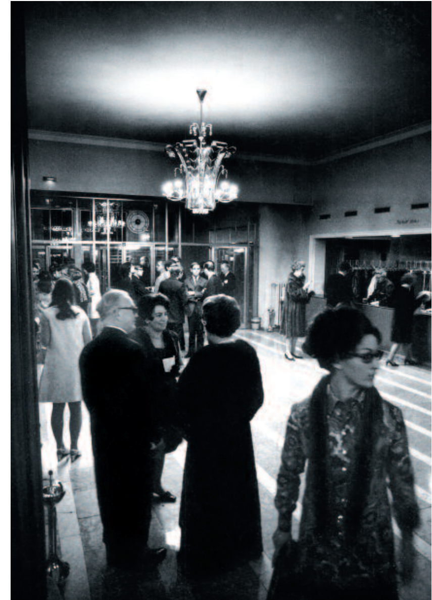
Nach dem Umbau: das Theater-Foyer, ein mondäner Ort der Begegnung.