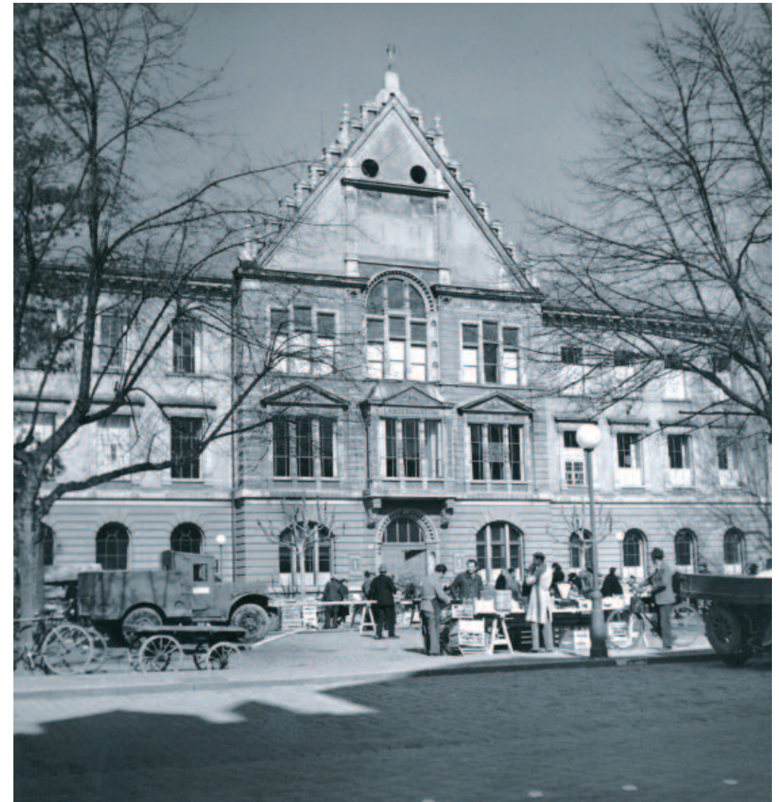
Seit 1905 beherrscht das Landesmuseum den Kornmarktplatz. Die Aufnahme aus den frühen 1950er-Jahren zeigt die Fassade vor der Umgestaltung der Jahre 1956 bis 1960. In der unmittelbaren Nachkriegszeit fand der Wochenmarkt auf dem Parkplatz vor dem Landesmuseum statt.

Da private Mäzene kaum mehr in Erscheinung traten, sah es Tizian als kommunale Aufgabe an, die heimischen Kulturschaffenden zu unterstützen und zu fördern. So wurden bei öffentlichen Bauten im Rahmen von einem bis zwei Prozent der Bausumme künstlerische Aufträge vergeben und regelmäßig Werke der bildenden Kunst angekauft. Auch der 1957 gestiftete „Hugo-von-Montfort-Preis“ für Dichtung, Wissenschaft, Malerei und Plastik diente dem Zweck der